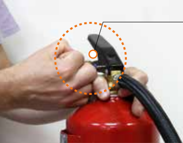
SEGURTASUN-UZTAIA ANILLA DE SEGURIDAD